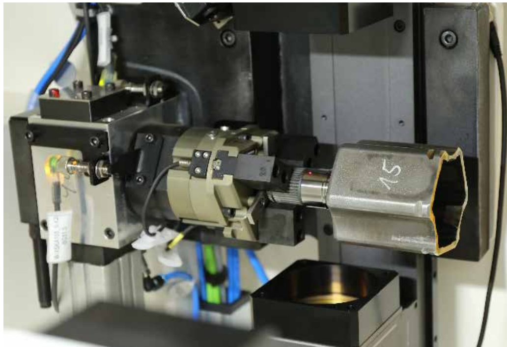
Optisches Vermessen des Werkstückes