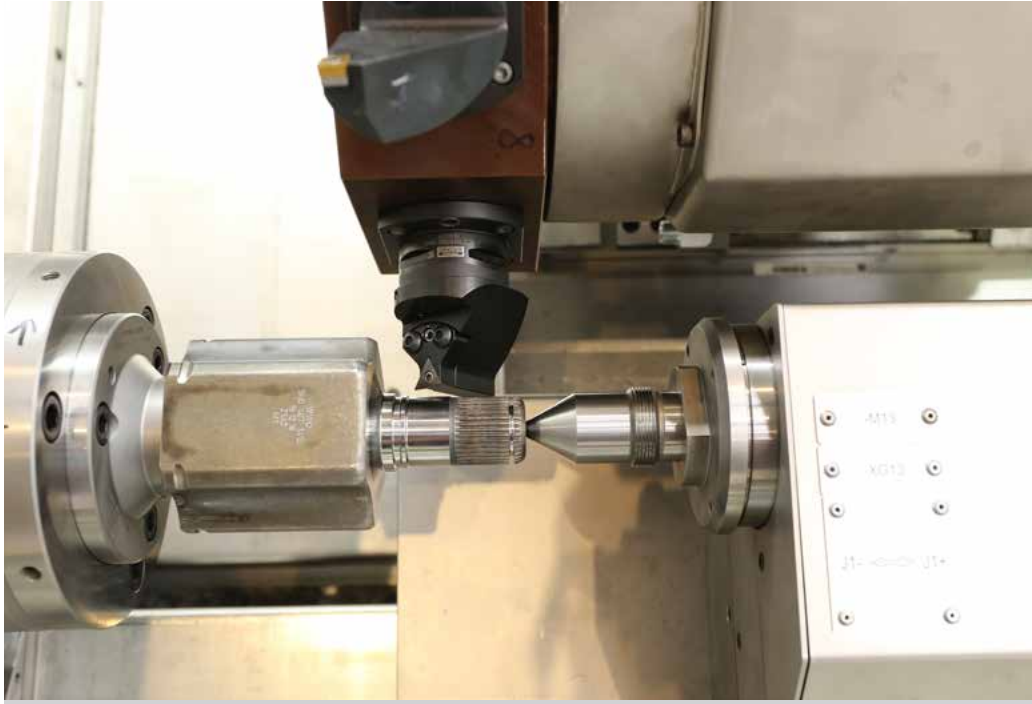
Drallfrei Drehen der Dichtring-Lauffläche mit der Y-Achse